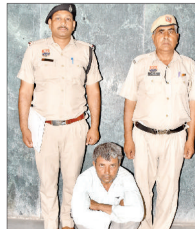
झंझर। पुलिस की गिरफ्त में आरोपी।