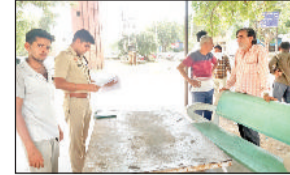
झज्जर। नागरिक अस्पताल परिसर में पोस्टमार्टम के लिए कागजी कार्यवाई करते हुए पुलिसकर्मी।