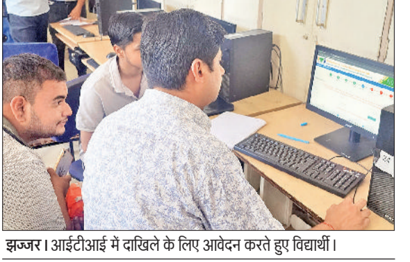
झज्जर। आईटीआई में दाखिले के लिए आवेदन करते हुए विद्यार्थी।