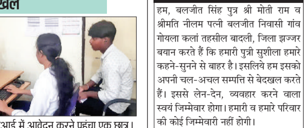
बहादुरगढ़। आईटीआई में आवेदन करने पहुंचा एक छात्र।