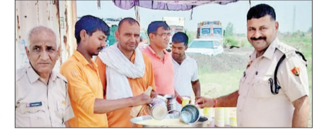
बहादुरगढ़। केएमपी थाने के पास पुलिस की ओर से लगाई गई छबील।