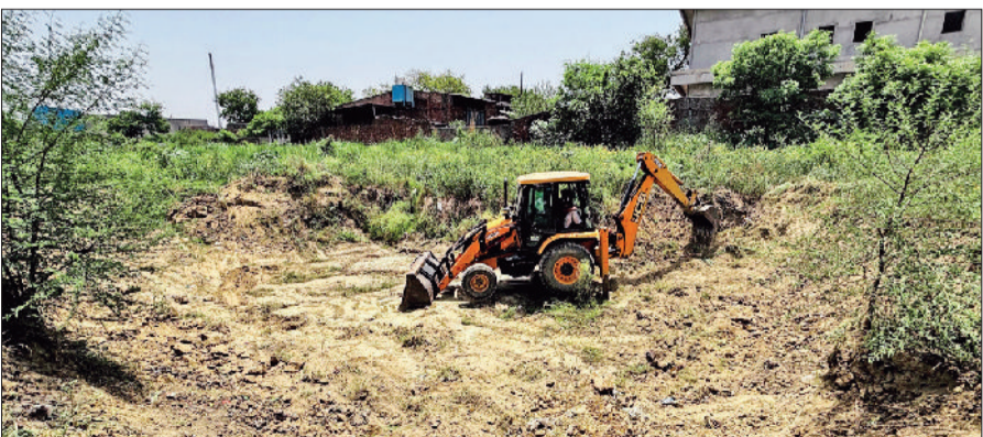
बहादुरगढ़। गोरैया साइट पर तैयार किया जा रहा पौड।

रोहतक-दिल्ली मार्ग पर गोरैया टूरिज्म कॉम्प्लेक्स के साथ लगती ग्रीन बेल्ट को मिनी जंगल के रूप में तब्दील करने के लिए संघर्षशील जनकल्याण सेवा समिति व क्लिन एंड ग्रीन ट्रस्ट के सदस्य लगातार प्रयासरत हैं। यहां काफी संख्या में पौधे लगाकर उनकी देखरेख की जा रही है। वहीं अब वर्षा जल संग्रहण के लिए इस साइट पर तीन मिनी पौड तैयार किए जा रहे हैं। जब ये पूरी तरह से तैयार हो जाएंगे तो अर्संख्य जीवों की प्यास बुझाएंगे। दरअसल, पिछले साल यहां दोनों टीमों ने निरंकारी सत्संग भवन सांखोल और अन्य सामाजिक संस्थाओं के साथ मिलकर एक हजार से अधिक पौधे लगाए थे। इस जगह को बहादुरगढ़ के मिनी फॉरेस्ट में बदलने की दिशा में कदम बढ़ाया था। संस्था सदस्यों की मांगों तो पिछले साल लगे सभी पौधे आज अच्छी वृद्धि कर रहे हैं।