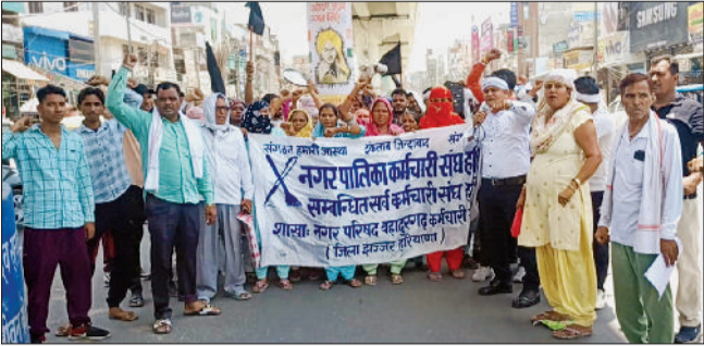
बहादुरगढ़। मंगलवार को शहर में प्रदर्शन करते सफाई कर्मचारी।