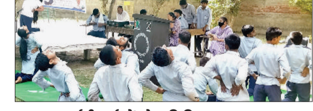
बहादुरगढ़। राजकीय औद्योगिक प्रशिक्षण संस्थान बहादुरगढ़ में आयुष विभाग के सहयोग से योग दिवस की तैयारी को लेकर चल रहे दो दिवसीय योग प्रशिक्षण शिविर का मंगलवार को समापन हो गया।