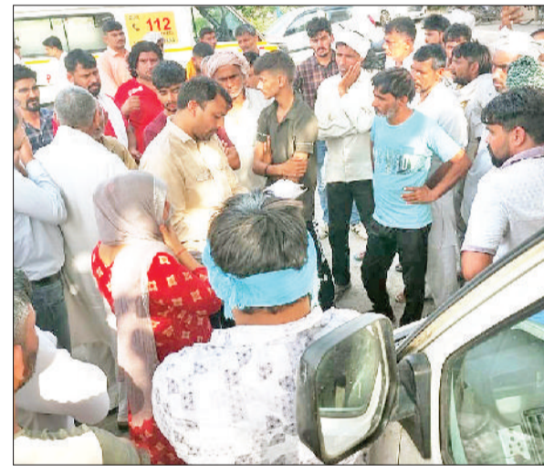
झंझर। नागरिक अस्पताल में उपस्थित ग्रामीण और परिजन।