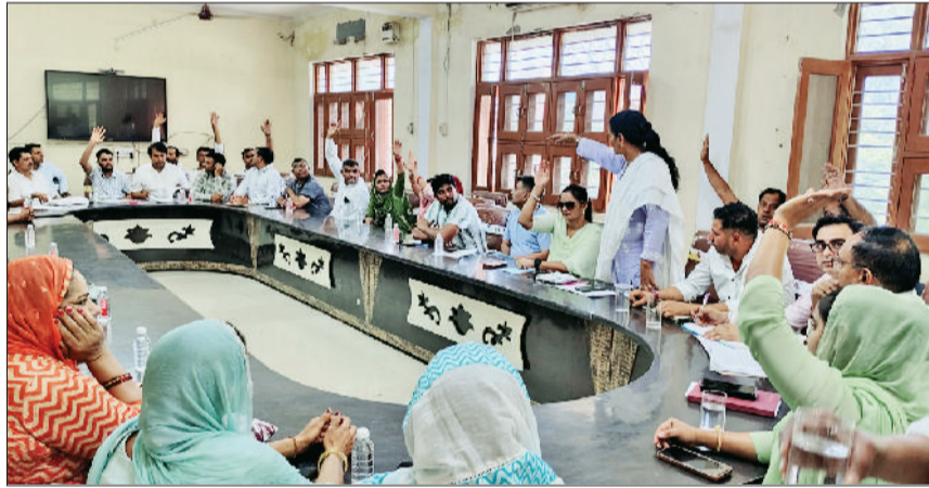
बहादुरगढ़। बैठक में हाथ उठाकर अपनी सहमति देते खंड समिति सदस्य।